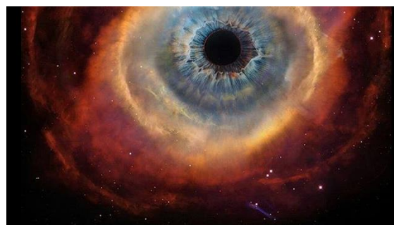
«Guds auge» er restane av ei sprengt kjempestjerne

Du er også velkomen til å ta kontakt med oss i Kristkyrkja på Stord. Me vil gjerne hjelpa deg å finna Gud, din skapar og Far.